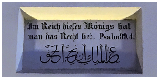
Abb. 2: Inschrift über der Tür von Abb. 1. Der arabische Text ist die Übersetzung des Psalm-Verses, 2019.