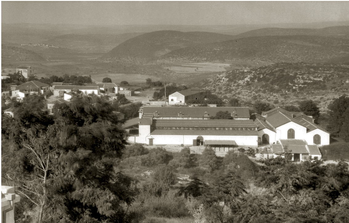
Abb. 6: Weinkellereien in Sichron Jakob, geplant von Architekt Gottlieb Schumacher, um 1910.