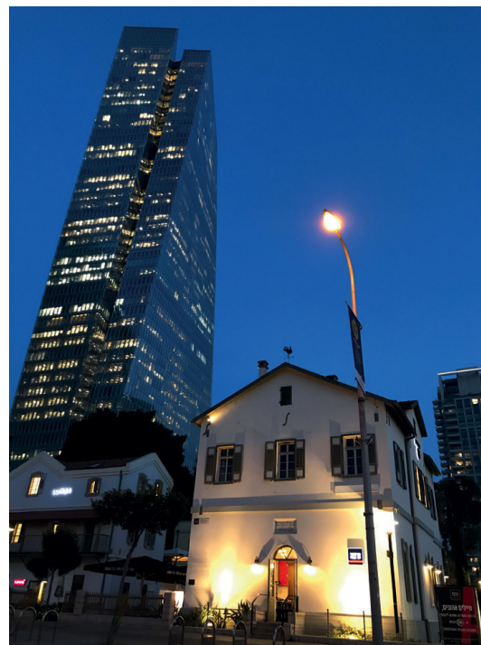
Abb. 1: Erstes Gemeindehaus und Schulhaus der Templer in Saron von 1872. Heute als Erinnerungsort integriert in ein „hippes“ Ausgehviertel Tel Avivs, 2019.

Eine kleine Gruppe, Jerusalemsfreunde genannt und Anhänger der aus dem württembergischen Pietismus entstandenen Tempelgesellschaft , fand aus religiösen Gründen ihr Auswanderungsziel im Heiligen Land. Sie bildeten dort die größte Gruppe deutscher Einwanderer. In einer ersten Auswanderungswelle nach der Mitte des 19. Jahrhunderts kamen circa 750 Menschen, in die von den Osmanen regierte und vernachlässigte Provinz Palästina. Innerhalb von vier Jahren wurden vier deutsche Kolonien gegründet – 1869 in Haifa und Jaffa, 1871 in Saron, heute mitten in der Stadt Tel Aviv, und 1873 eine Kolonie in der Rephaim-Ebene bei Jerusalem. Die Templer trugen in vielen Bereichen zur Modernisierung des Landes bei und leisteten umfang-