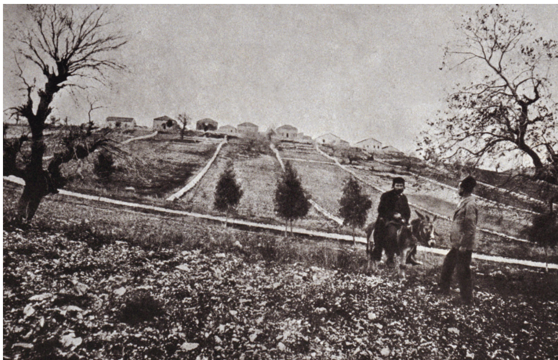
Abb. 5: Das jüdische Dorf Bat Schlomo, 1899.